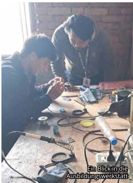
Ein Blick in die Ausbildungswerkstatt

es Selbstbewusstsein und Zuversicht. Viele berichteten, dass sie sich nun zutrauen, ein eigenes kleines Geschäft zu eröffnen oder eine feste Anstellung zu finden. Ein Teilnehmer des Programms fasst seine Erfahrung zusammen: „Das Projekt hat mir gezeigt, dass ich nicht auf Hilfe warten muss. Ich kann selbst etwas bewirken.“