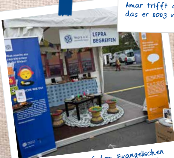
'Lepra begreifen' auf dem Evangelischen Kirchentag: Mit Ofenhandschuhen wurde Lepra simuliert - eine intensive Erfahrung.