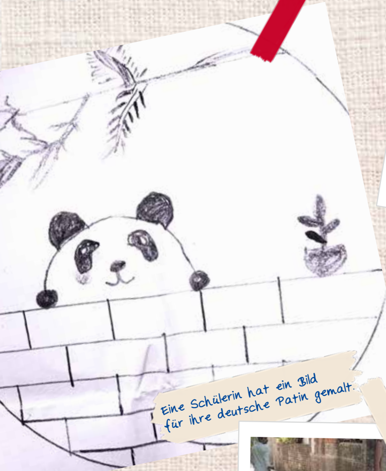
Eine Schülerin hat ein Bild für ihre deutsche Patin gemalt.