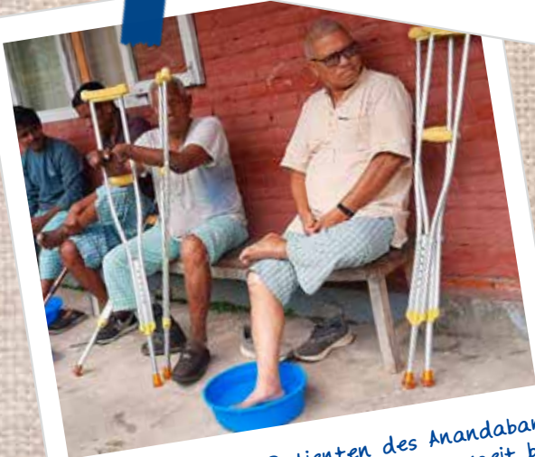
Leprabetroffene Patienten des Anandaban Hospital werden während der Monsunzeit bei New SADLE untergebracht.

Volontäre gesucht! Ob Organisationstalent, kreative Ader oder medizinisches Interesse - bei uns kannst du deine Fähigkeiten sinnvoll einsetzen und weiterentwickeln.